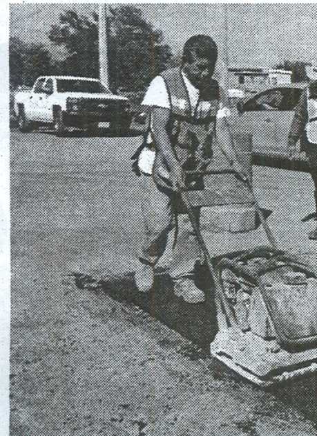
También supervisó los trabajos de recarpeteo para dar mayor tranquilidad a la ciudadanía y seguridad